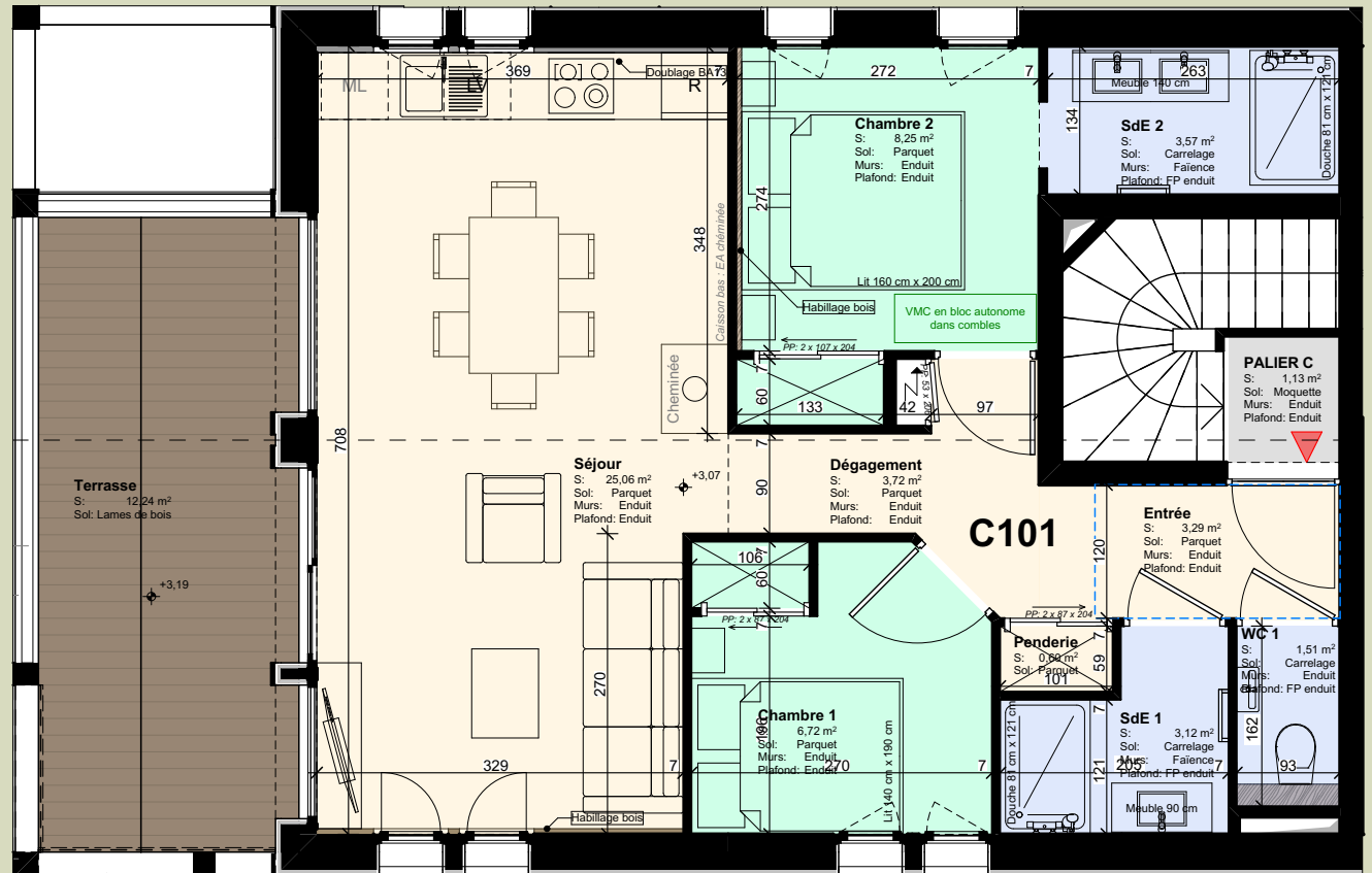
Niveau Entrée : R+1