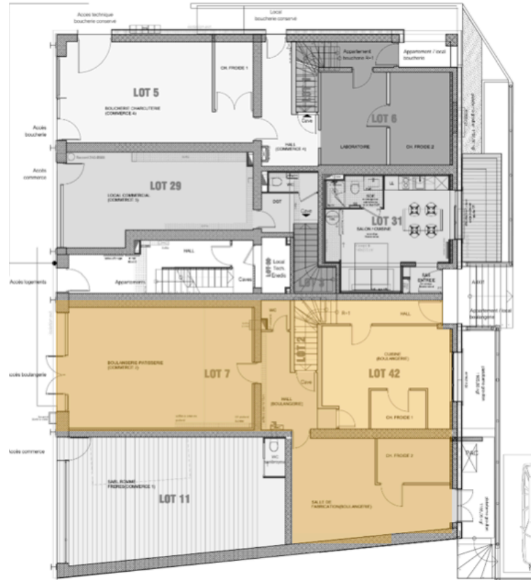
REZ DE ROUTE